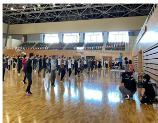
オータムフェスタと測定ブース