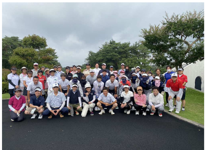
▲定期的に行っている社内ゴルフ会の様子