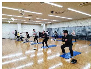
生活習慣病改善プロジェクト「健幸くらす」